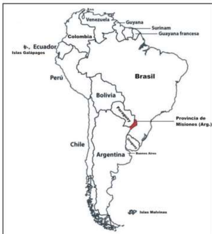
En rojo, Provincia de Misiones, Argentina. Intervención propia a partir de mapa disponible en la web.

A lo largo de su expansión como Estado-Nación, la Argentina constituyó fronteras con cinco países de la región. Para el caso que nos ocupa, la provincia argentina de Misiones se inserta como un calce entre dos países que no tienen al castellano como lengua predominante. Los idiomas oficiales del Paraguay son el español y el guaraní, siendo este último,